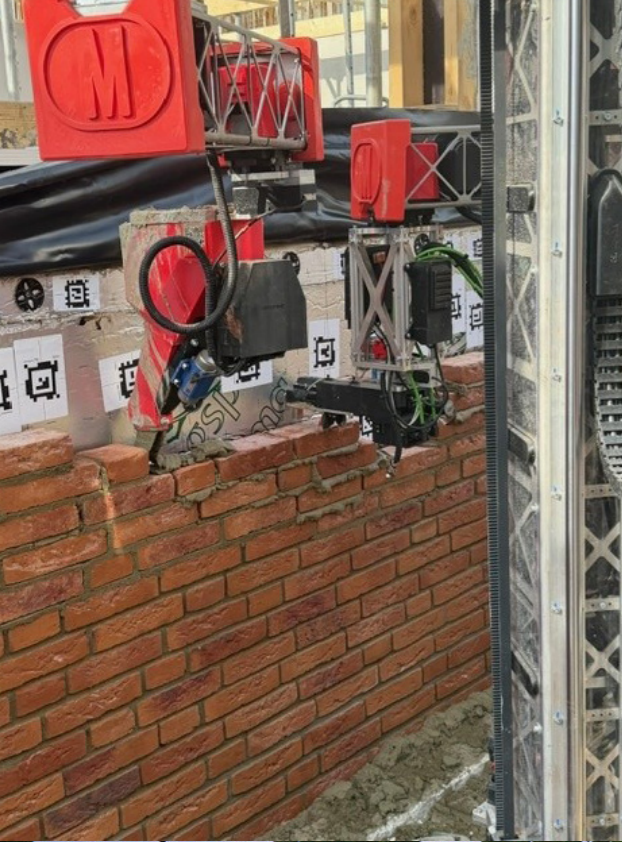
◀ Legging van de eerste steen door de metselrobot.