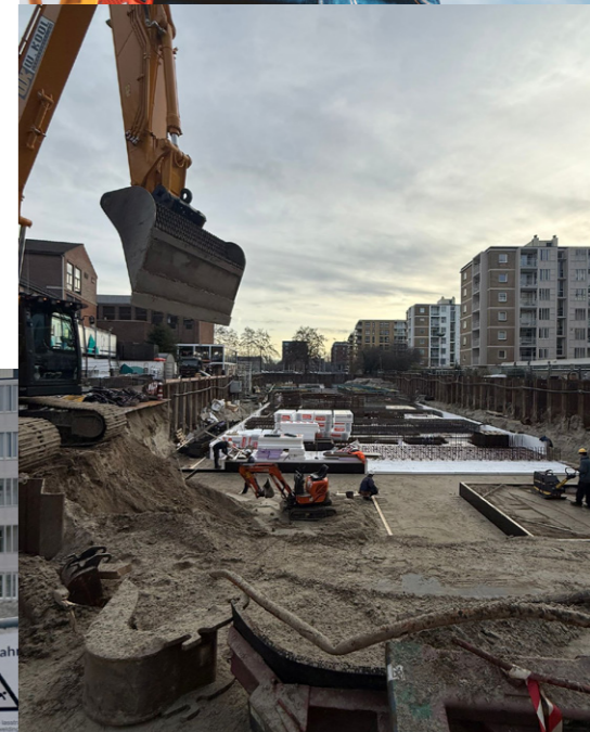
◀ Beelden van de fundering. ▶