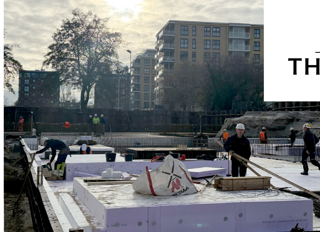
◀ Isolatie van de keldervloer.

// Bouwverkeer komt materiaal brengen; denk aan vloeren, balkonplaten, spanten en - later in het bouwproces - producten zoals binnenwanden en kozijnen. De materialen worden zoveel mogelijk in de ochtend geleverd. We starten rond 07.00 uur. Laden en lossen is afgestemd met het winkelcentrum.